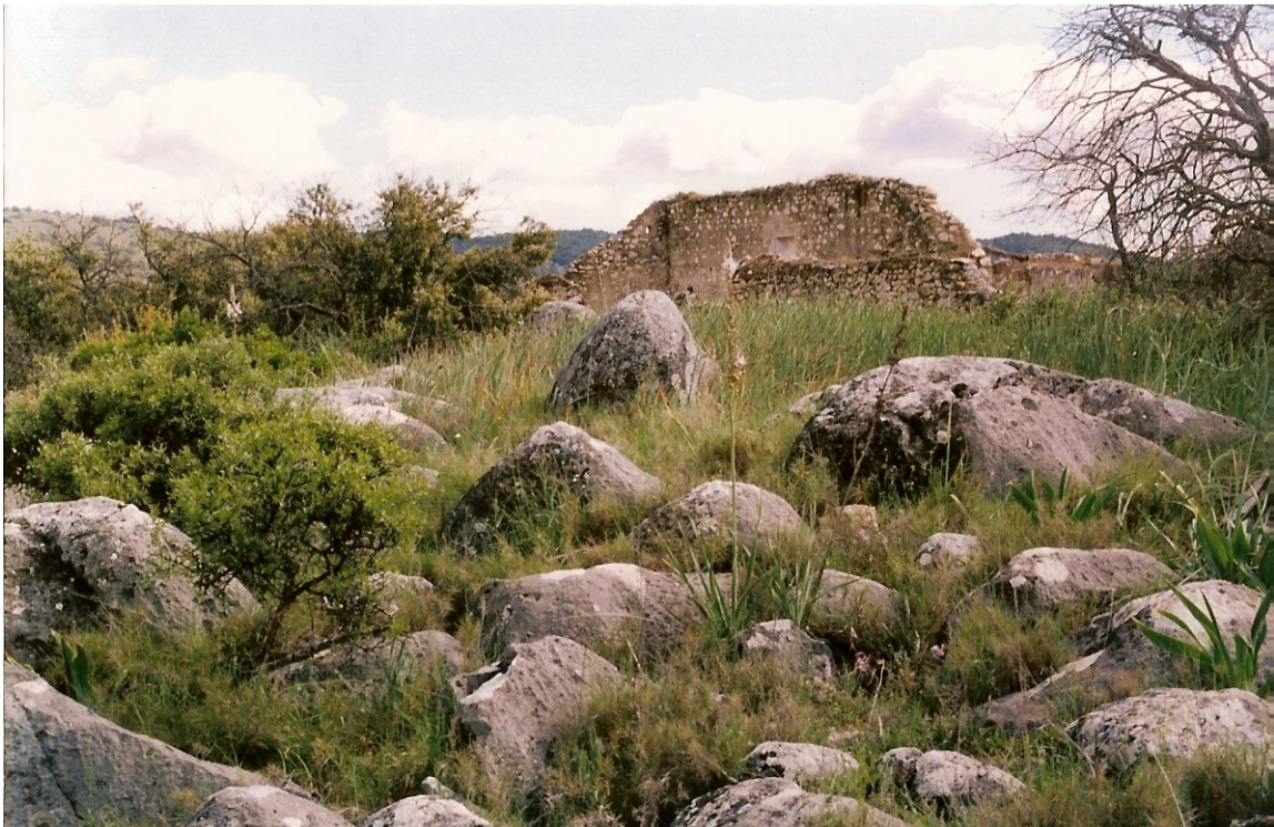
Instantánea del mismo.