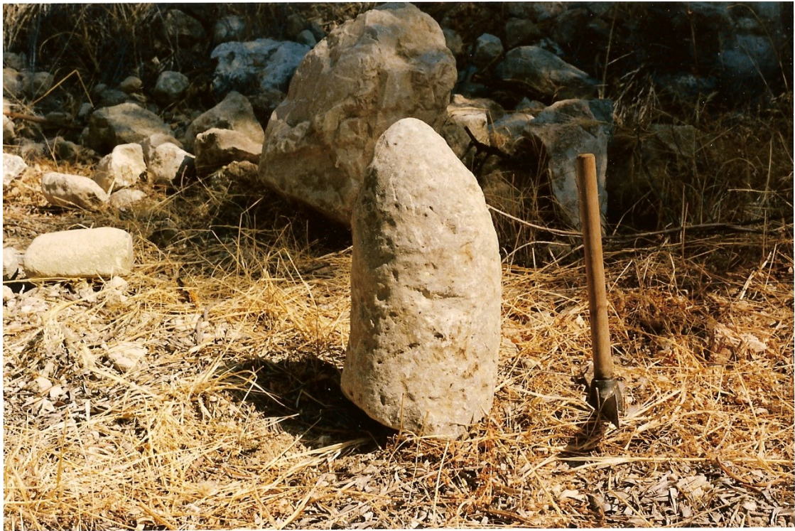
Instantánea del exvoto mencionado.

Fue localizada en el margen izquierdo de la Cuesta de los Pedregales.