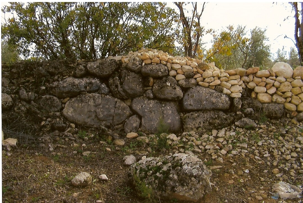
Base de muralla.

A poca distancia del camino del “Cañuelo”, Antigua calzada romana, que partía desde la carretera de Alcalá la Real, pasaba por “Los Cortijuelos”, el arroyo de las “Cañadas” donde son visibles las paredes y sillares de un puente, continuaba por “Las Torrecillas” hasta Illora, pasaba de Illora a Alomartes, por el camino viejo hasta el “Cortijo de Vita” (Tocón), hasta alcanzar Hueter Tájar, afloran restos del periodo romano en algunos puntos del margen izquierdo y derecho.