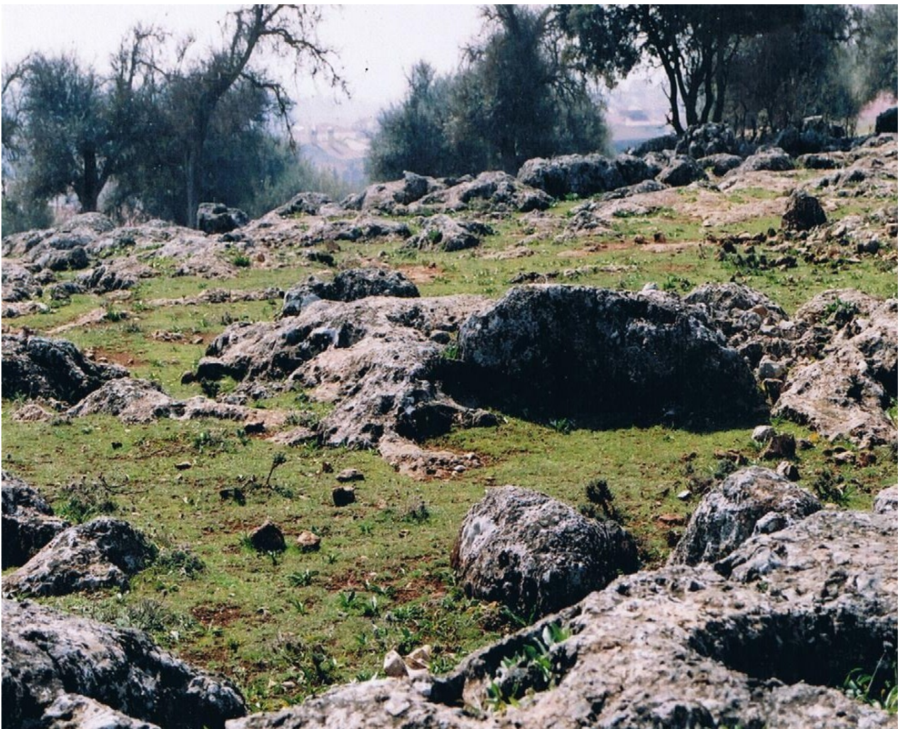
Instantánea de la pedriza.

Existen dos tipos de dólmenes, el tradicional y el arcaico.