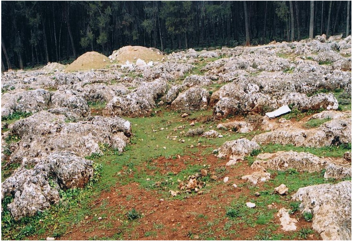
Otra instantánea de la zona.