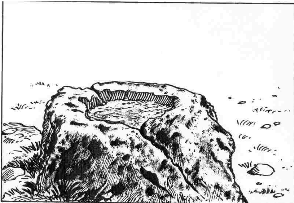
Dibujo o reproducción donde se aprecia la hendidura circular, ranura para salida de líquidos y bordes donde se aprecia la forma rustica de su elaboración.