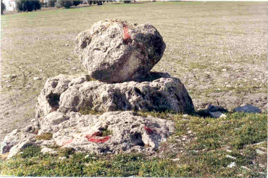
Instantánea del Altar desde el nivel de la Era.