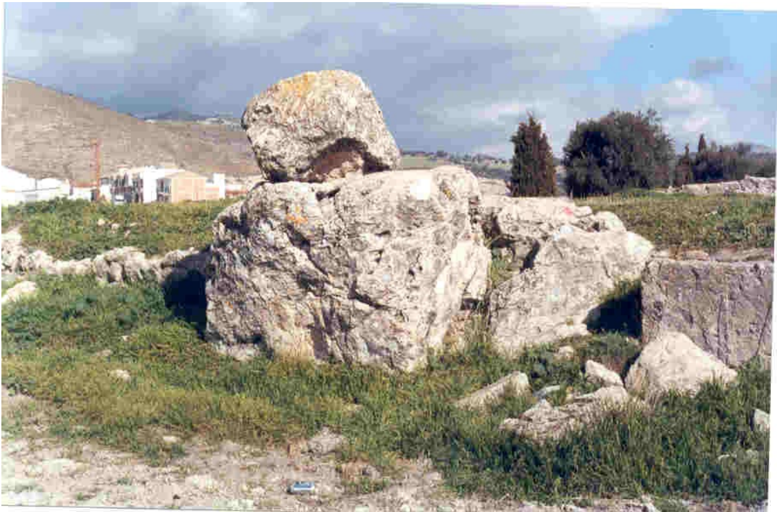
Lado Oeste de la roca sobre la que esta situado el Altar.