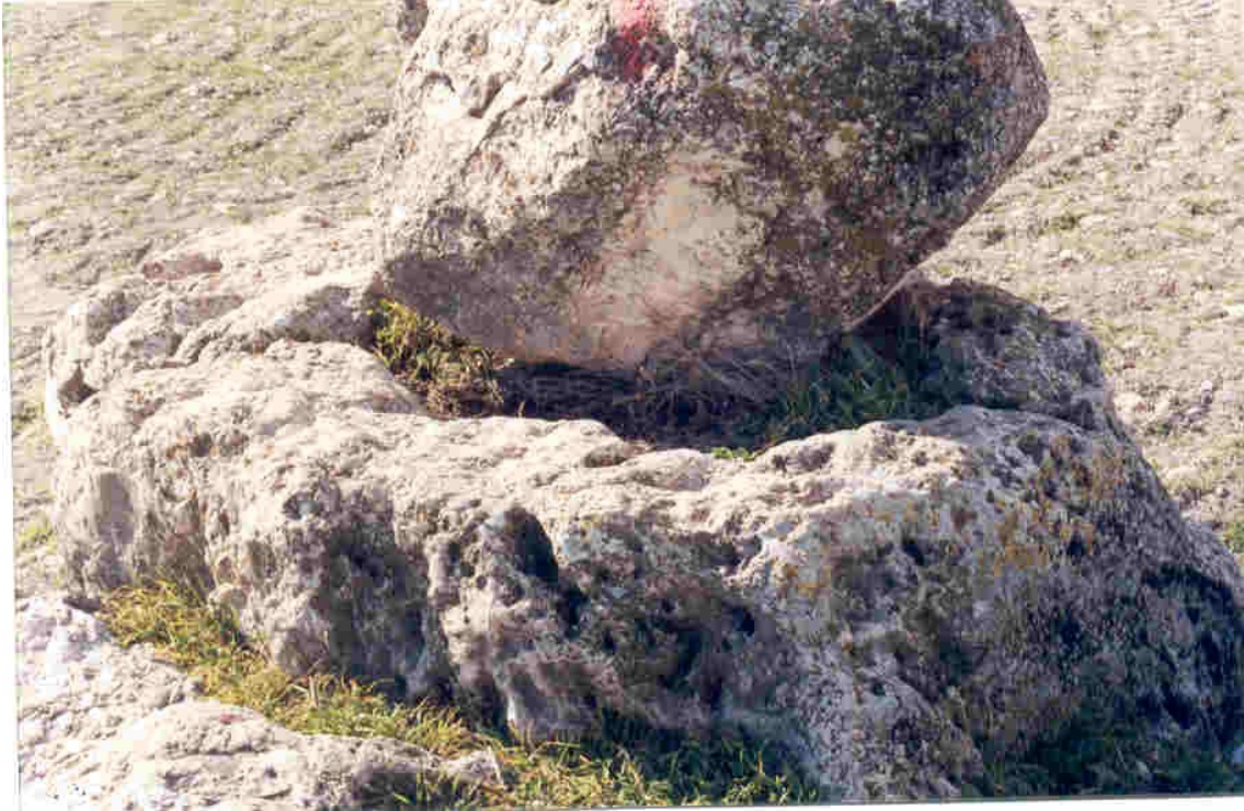
Detalle de la pileta y los bordes exteriores muy rústicamente elaborados.