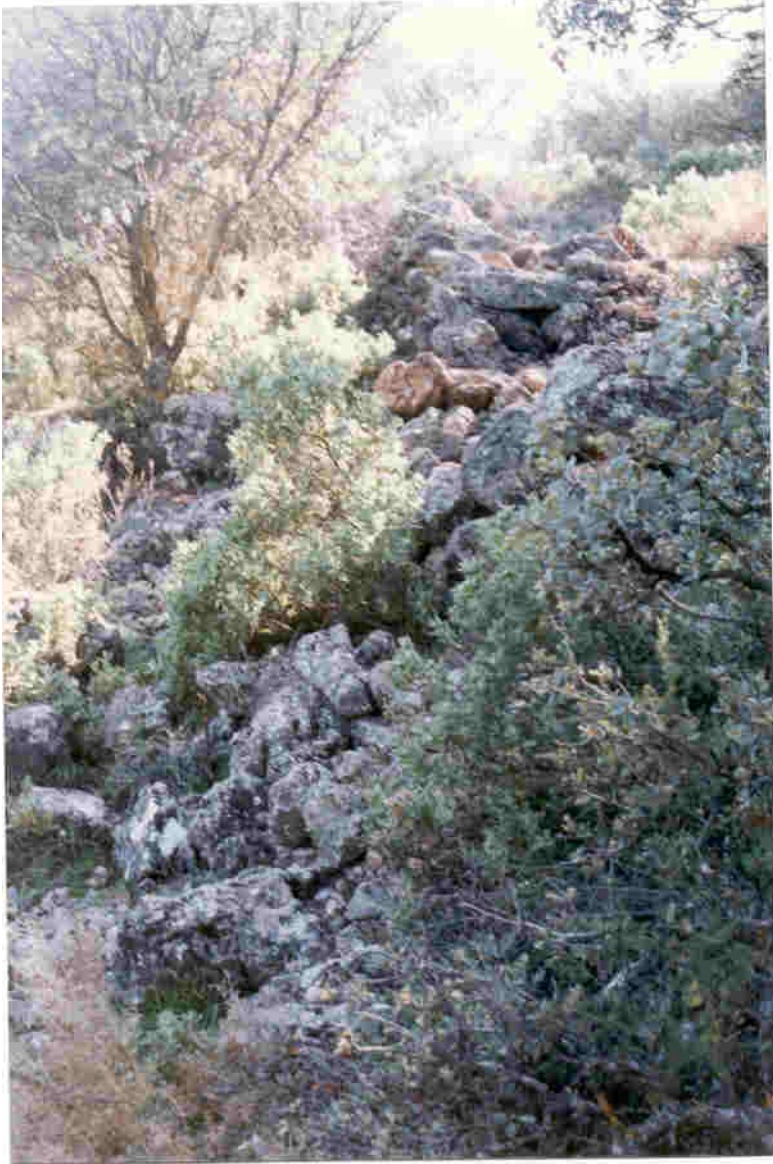
Muralla que protegía el poblado en la cara oeste.