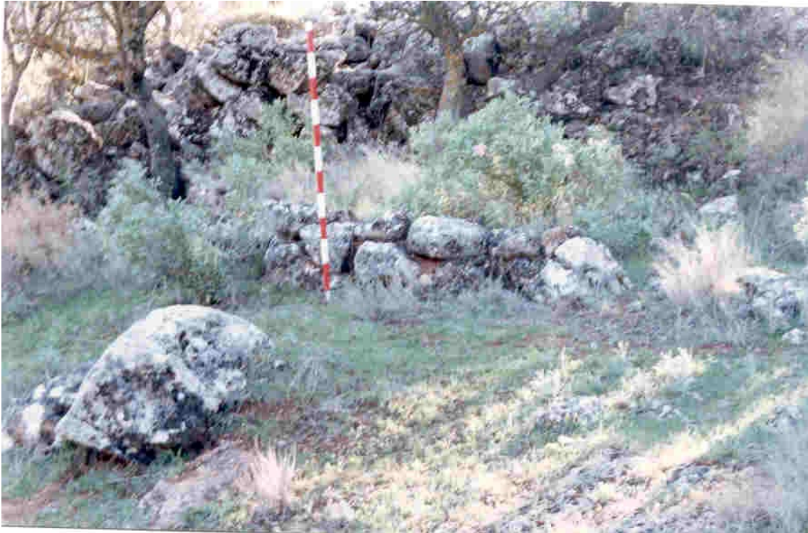
Restos de una planta de cabaña situada al sur del cerro en estudio.