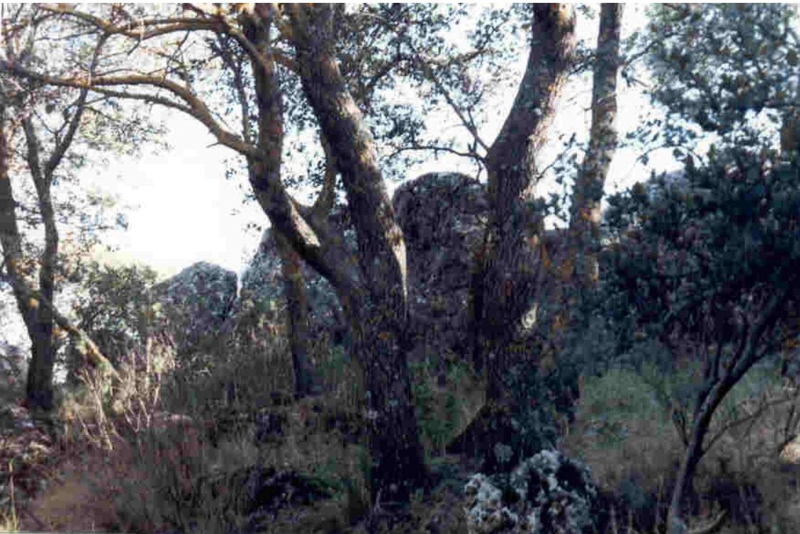
Restos de Muralla en el sureste del cortijo del Romero.