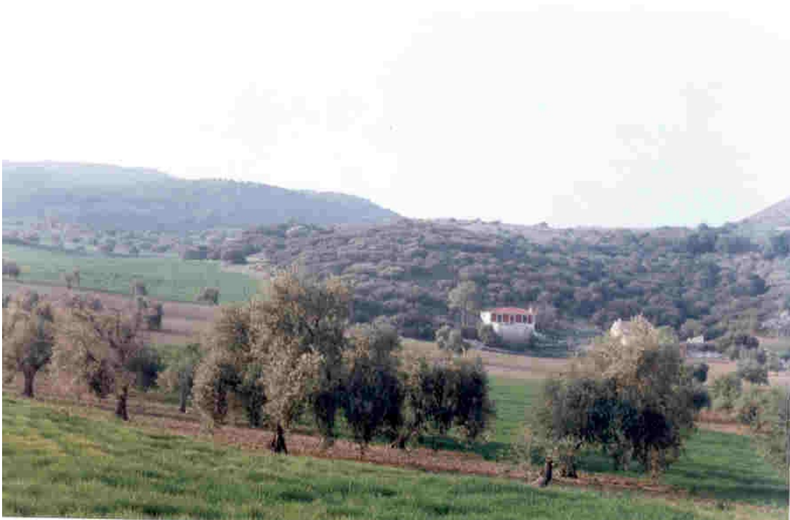
Instantánea del cortijo y cerro del Romero en la falda de Sierra de Madrid

En su parte oeste, existen otras murallas interiores, entre las encinas y la maleza, así como abundantes restos de castros, la mayoría muy deteriorados. Completos, sólo se encontraron seis.