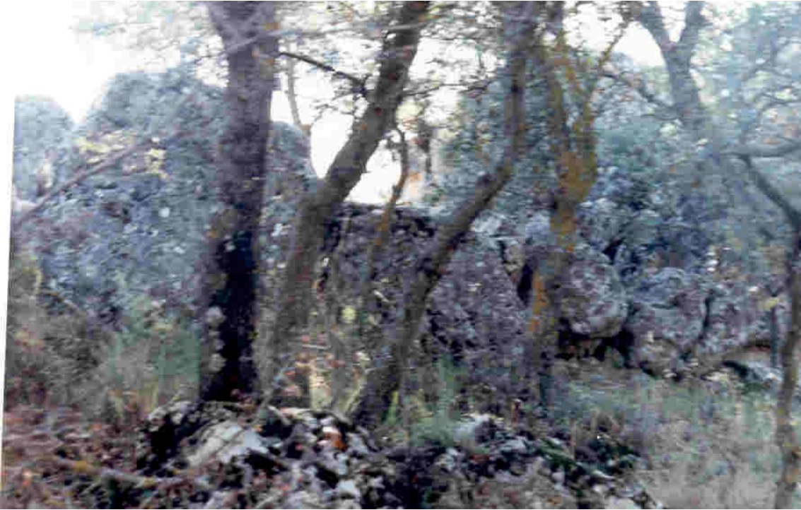
Restos de muralla que se localizan cubiertas de bosque Mediterráneo.