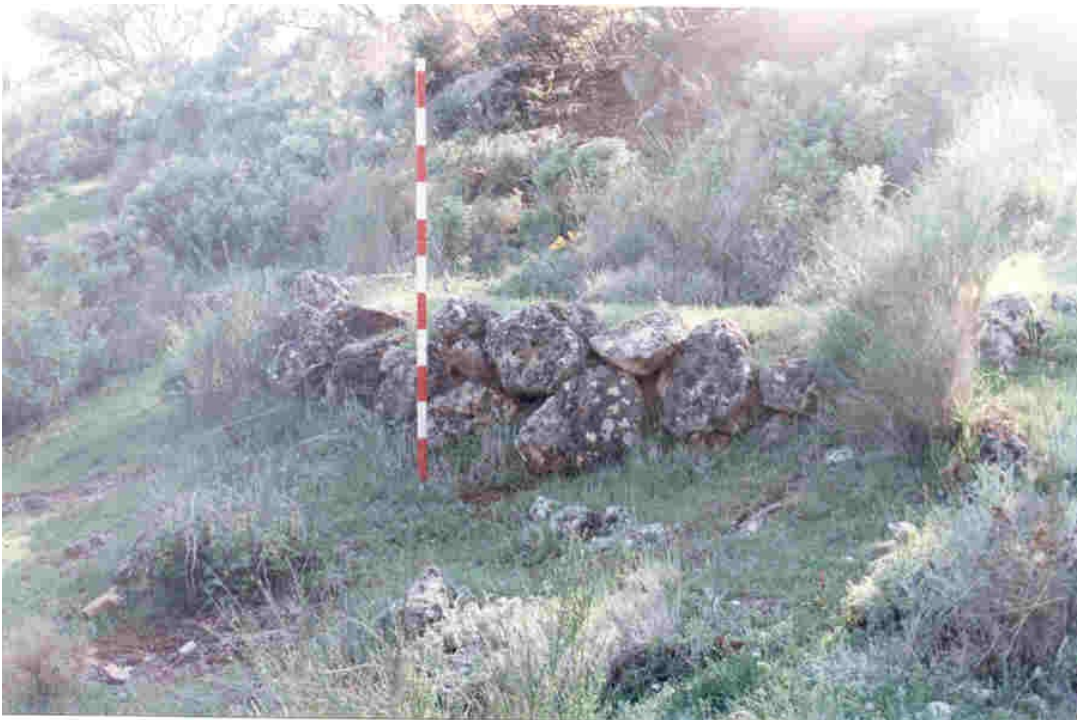
Instantánea de otra planta de cabaña.