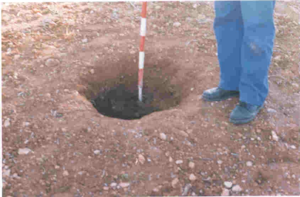
Silo cercano a las tumbas.