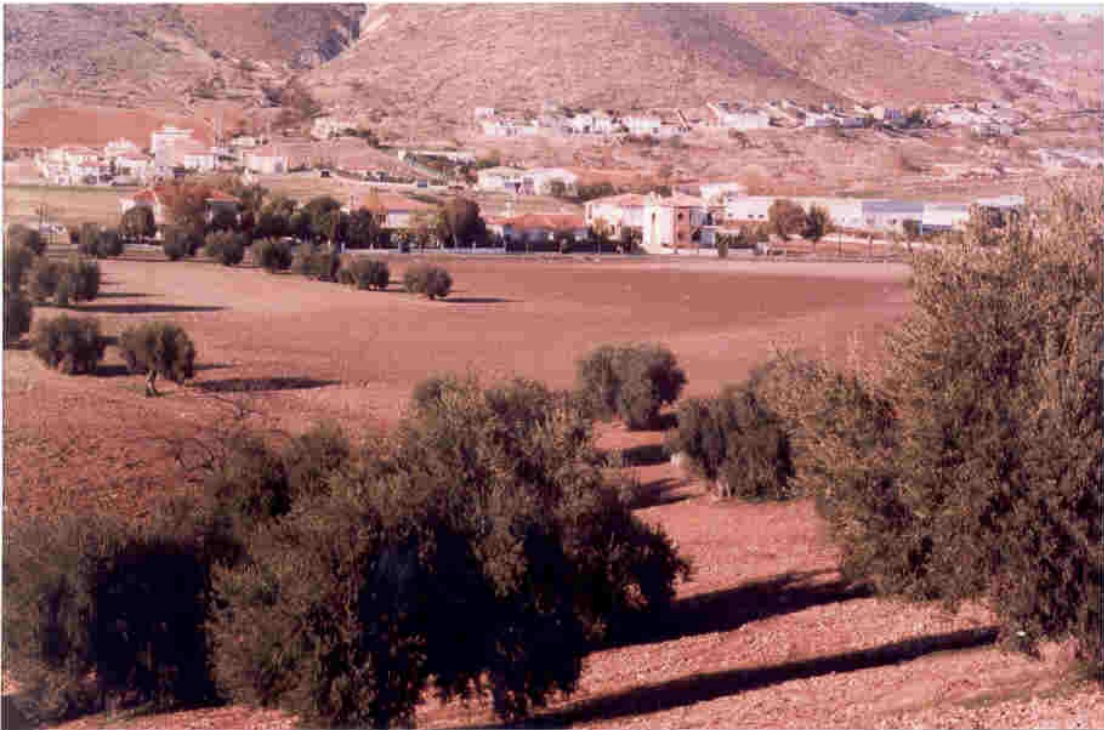
Desde la era de la Cima, vista del barrio de la Laguna.