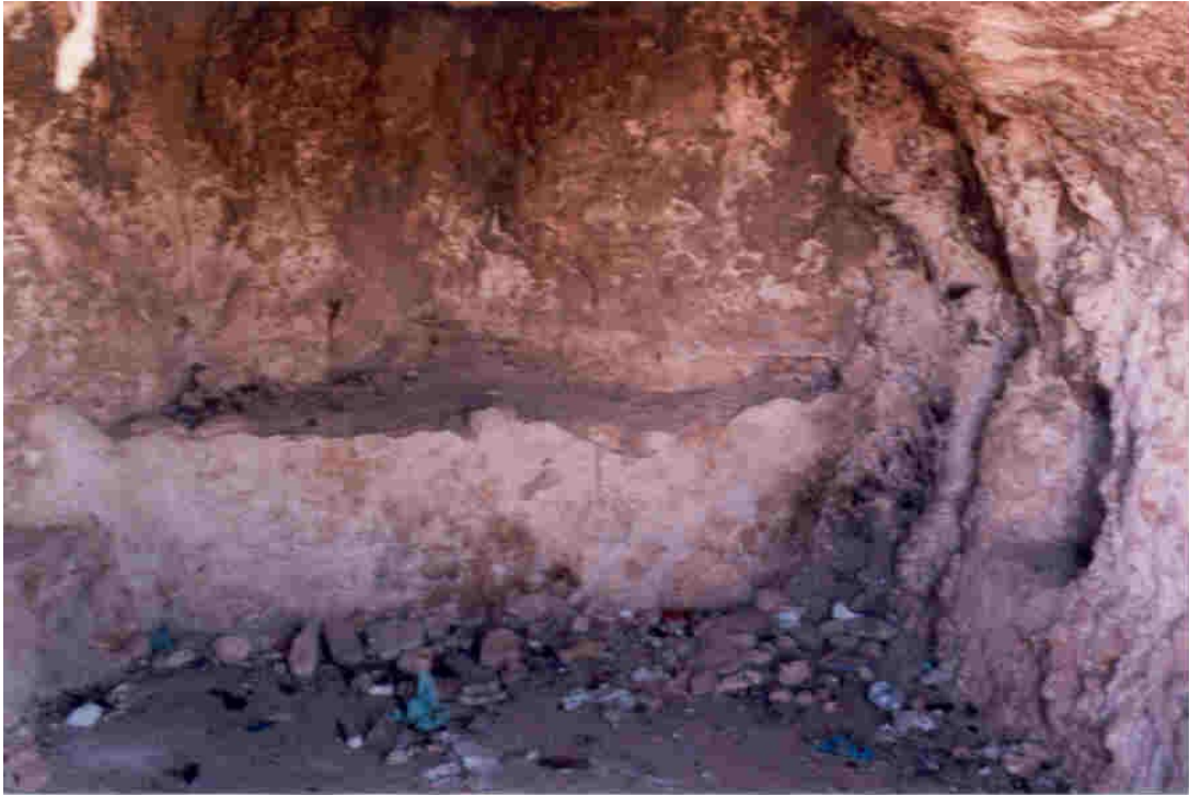
Interior de la tumba mayor.