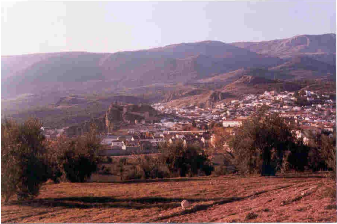
Vista de Íllora, desde la Haza de la Mata.