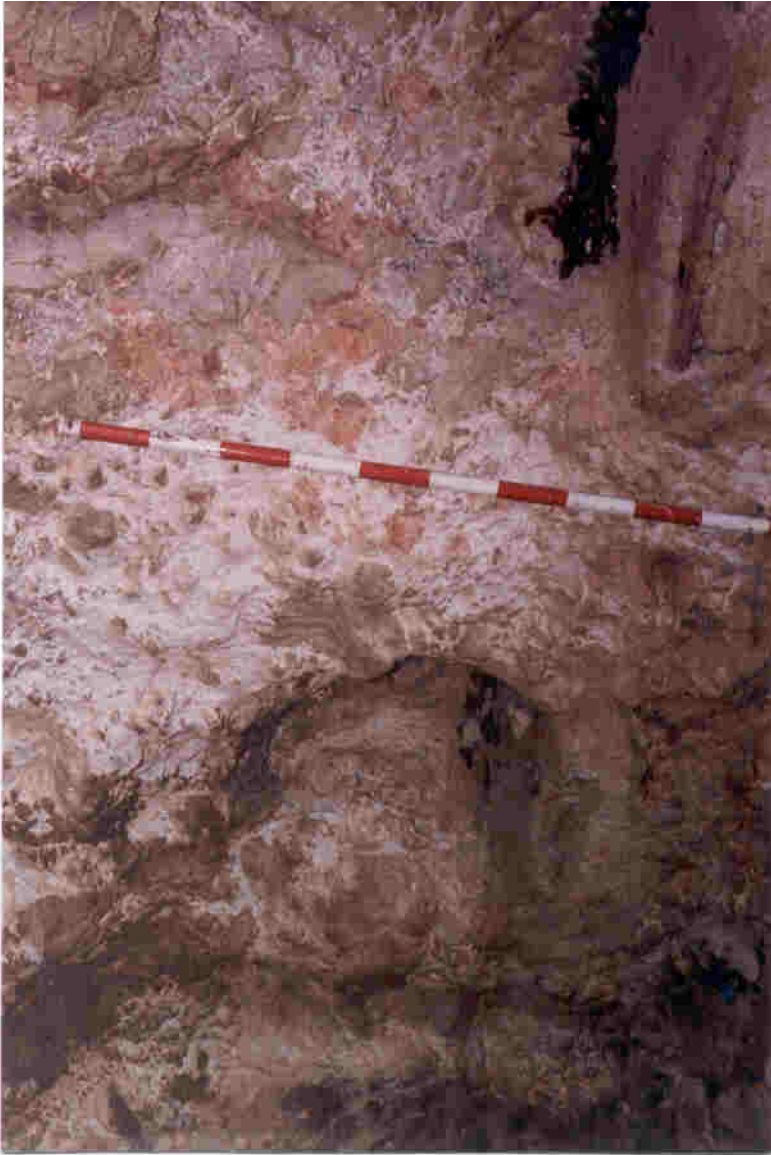
Interior de la tumba número uno – hornacina (Era de la Cima).