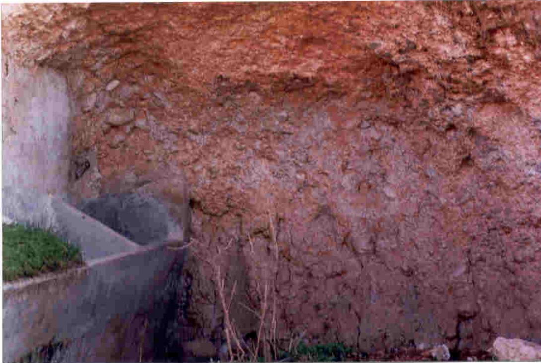
Tumba número dos, que fue utilizada como caballeriza.