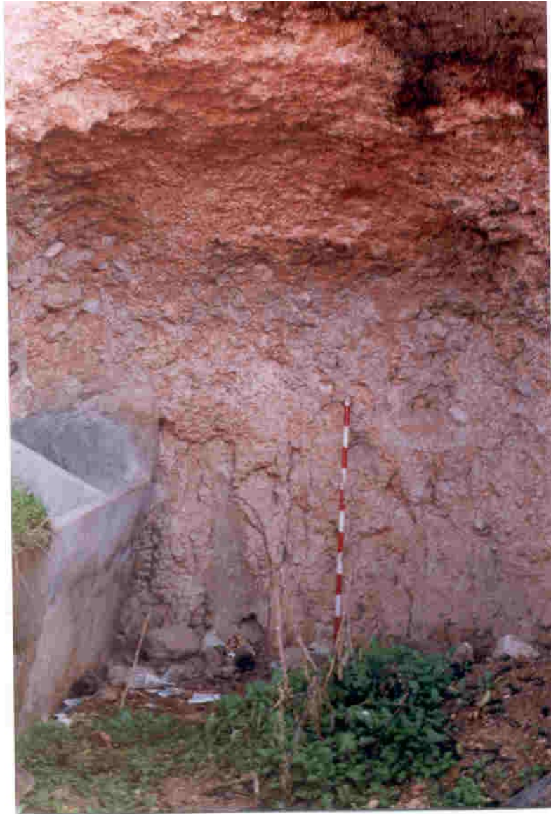
Interior de la tumba número dos, que fue utilizada en los años cincuenta como caballeriza (Era de la Cima).