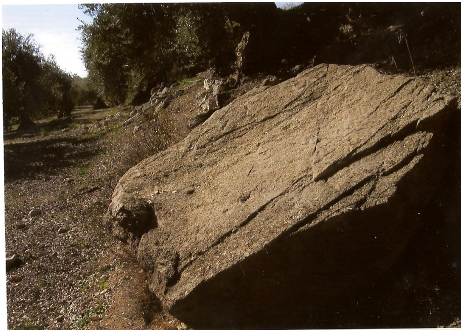
Instantánea del interior del cauce del arroyo.