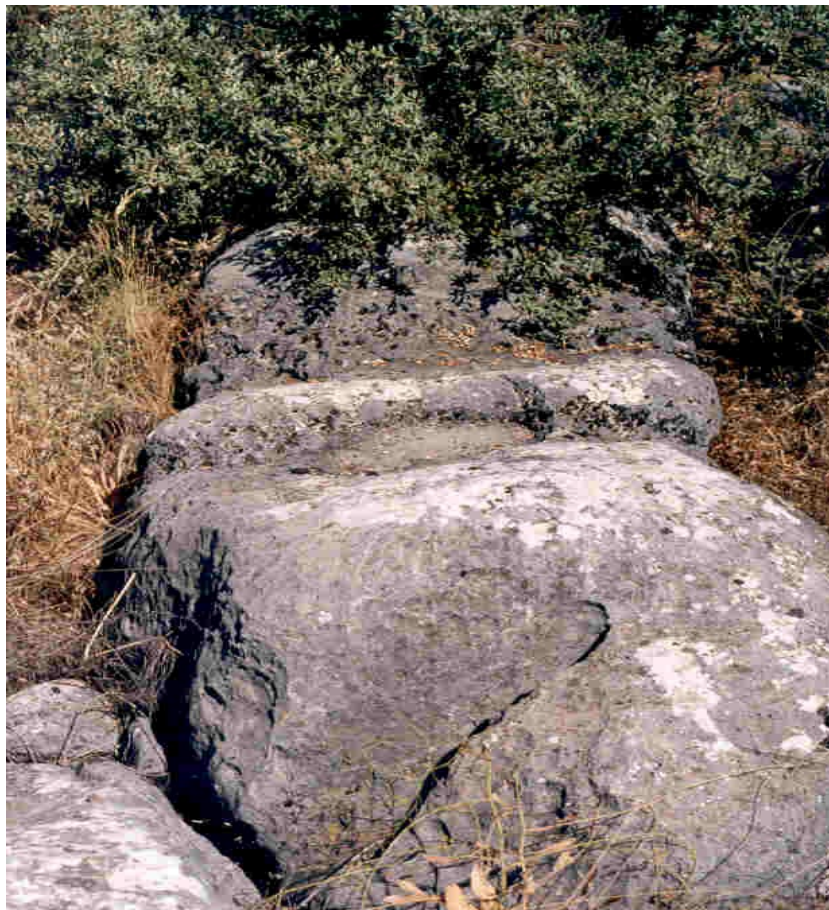
Instantánea de las rocas que se encuentran en este pago cercano.

El lugar está a 5 Km. de Illora por el carril que va desde éste pueblo a Obeilar por los Tajos de la Puentezuela.