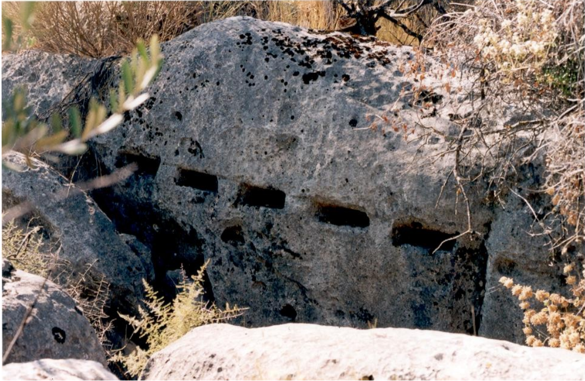
Sistema de corte de la roca, posiblemente de época romana, donde se introducía madera con agua que al dilatarse fragmentaba la roca.