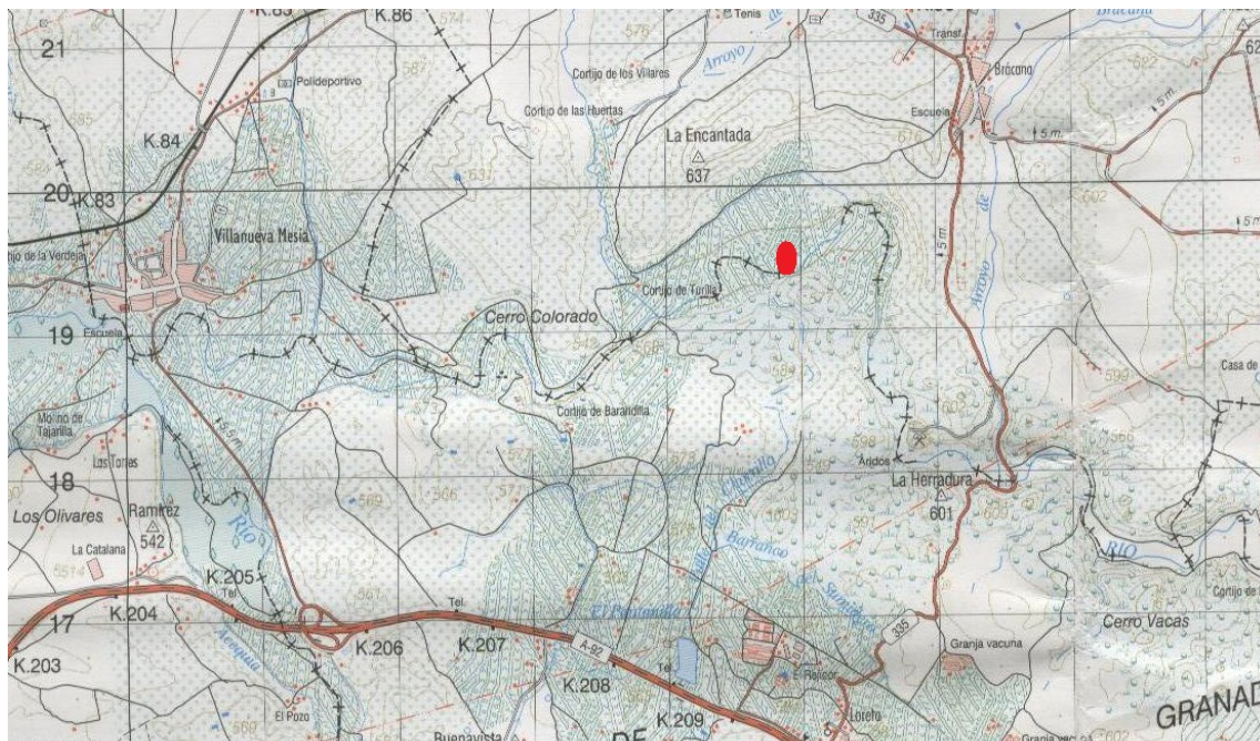
Situación de la Villa Romana.

El Barrando del Salado, otro pago de Casas Blancas situado más al sur, al realizar la excavación para colocar el sistema de riego, afloró cascajo romano con una gran cantidad de tabulas.