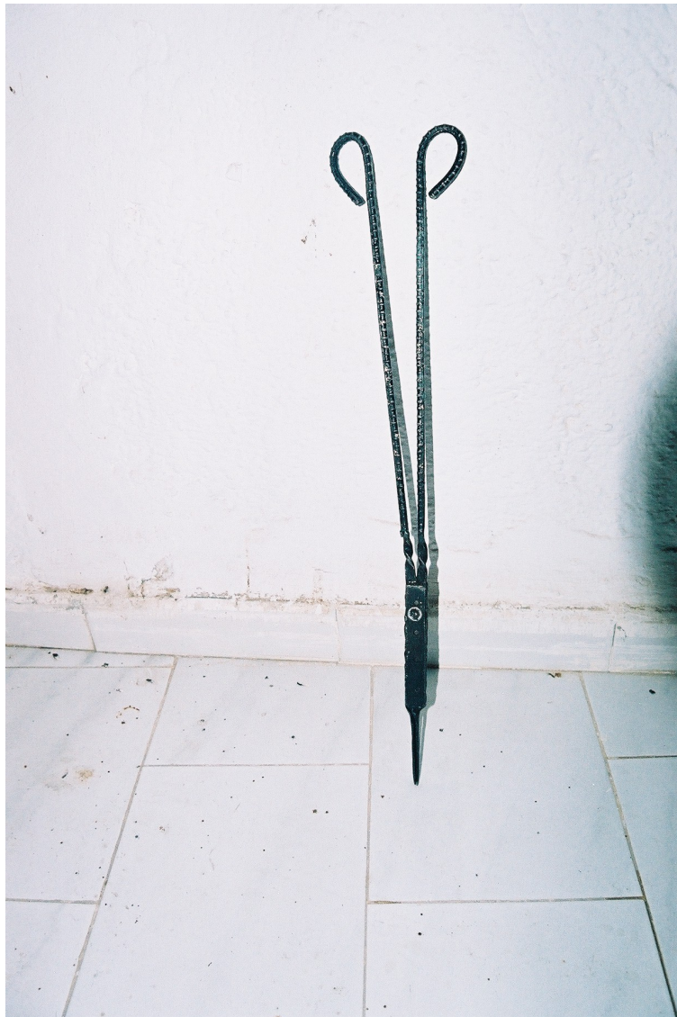
Instantánea de las mismas.