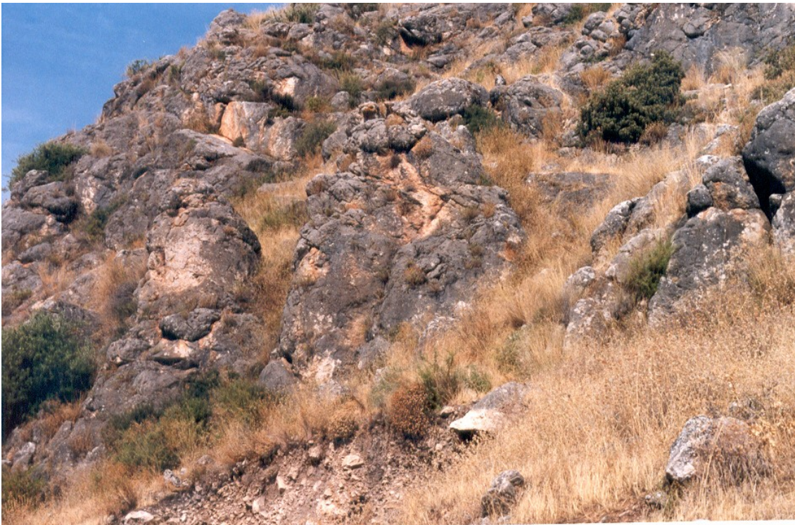
Desbaste realizado sobre la roca para darle forma de estatua menhir.