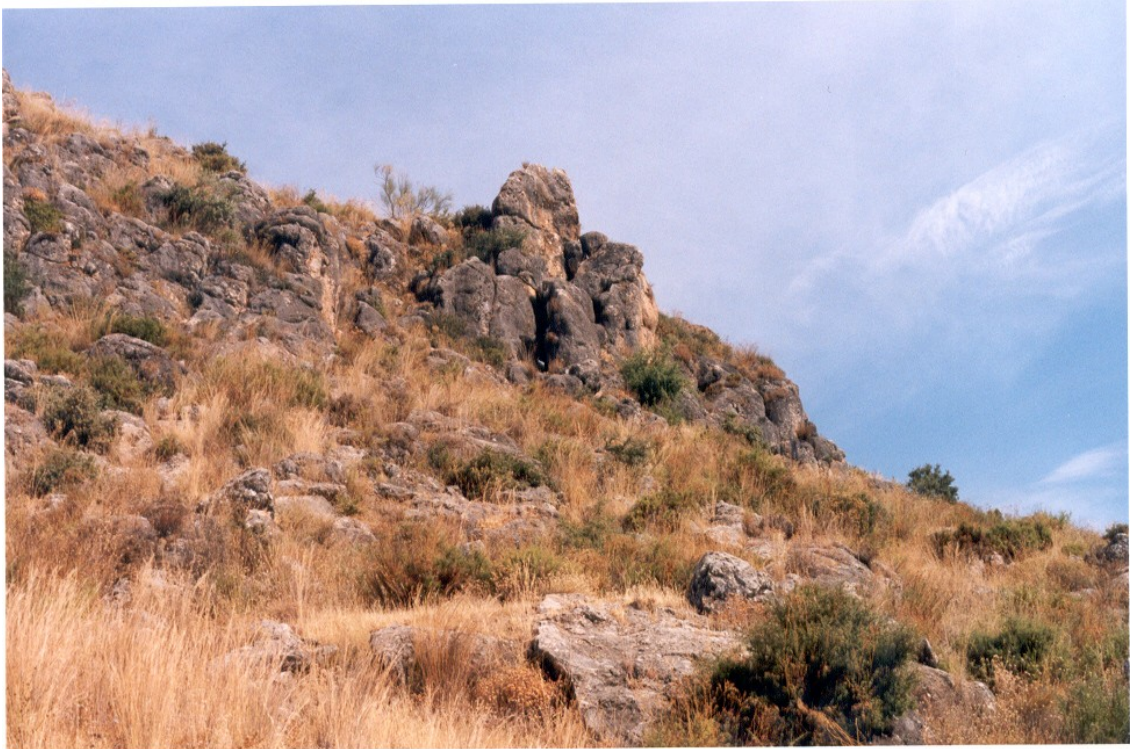
Ladera sur de la pedriza, piedras hincadas (posible estructura funeraria).