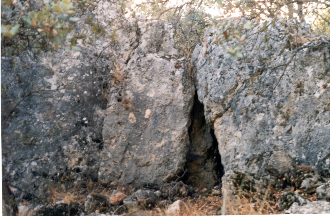
Pequeña cueva en la base de la zona sur.