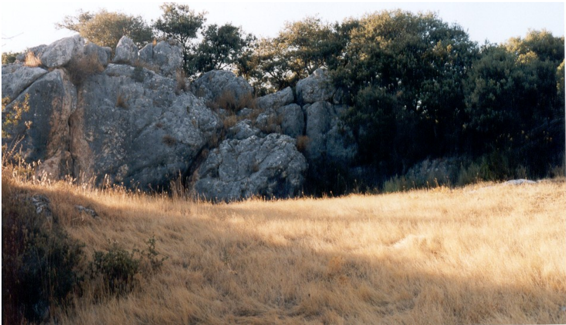
Instantánea de la zona este del recinto.