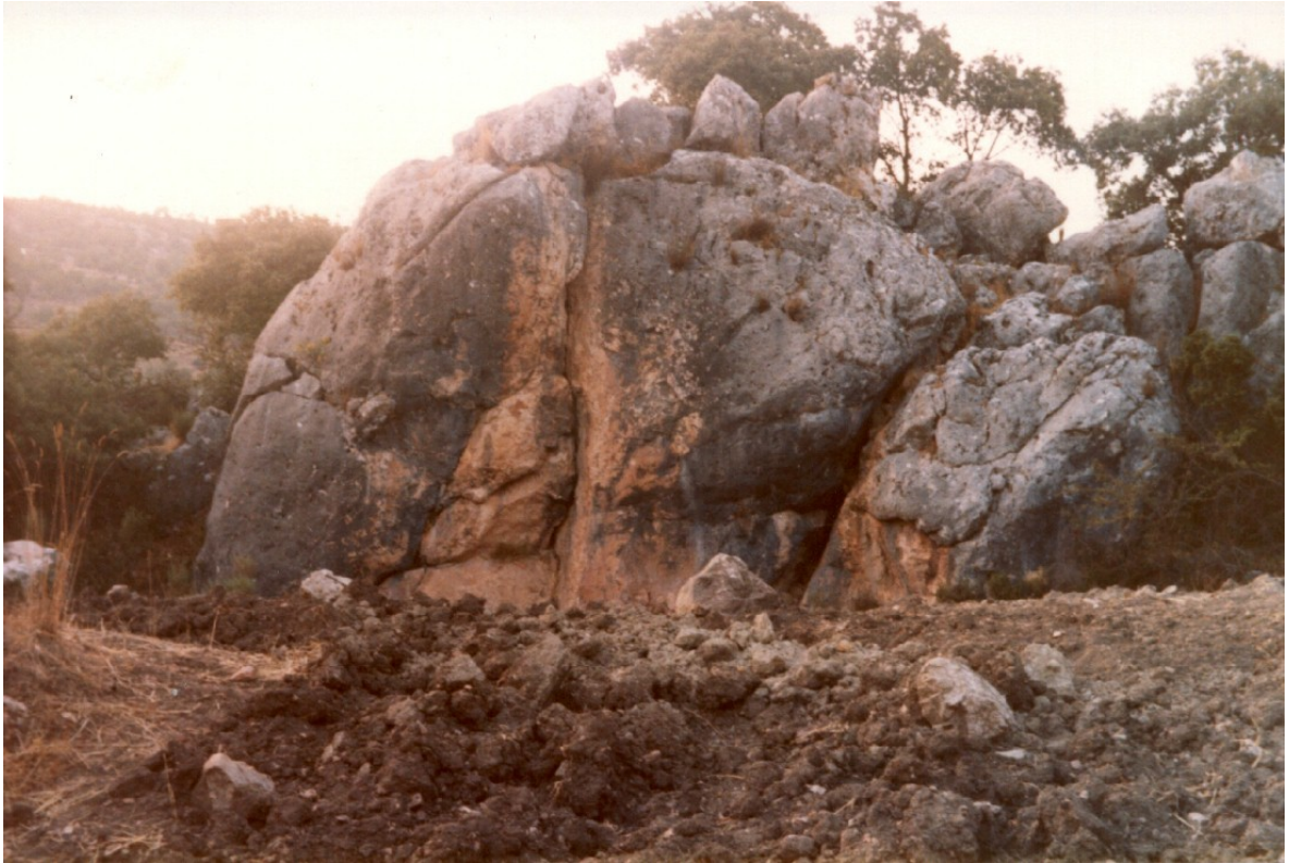
otro detalle mas amplio de la construcción megalítica en la zona sur.