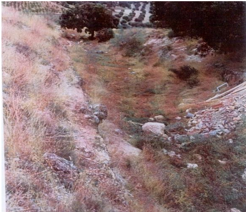
Detalle de la trinchera.

Se precisa con urgencia un cambio en la mentalidad de todos los vecinos del municipio, incluidos los que practican la política hoy los que la practiquen mañana para buscar los resortes necesarios que den luz y despierten la zona.