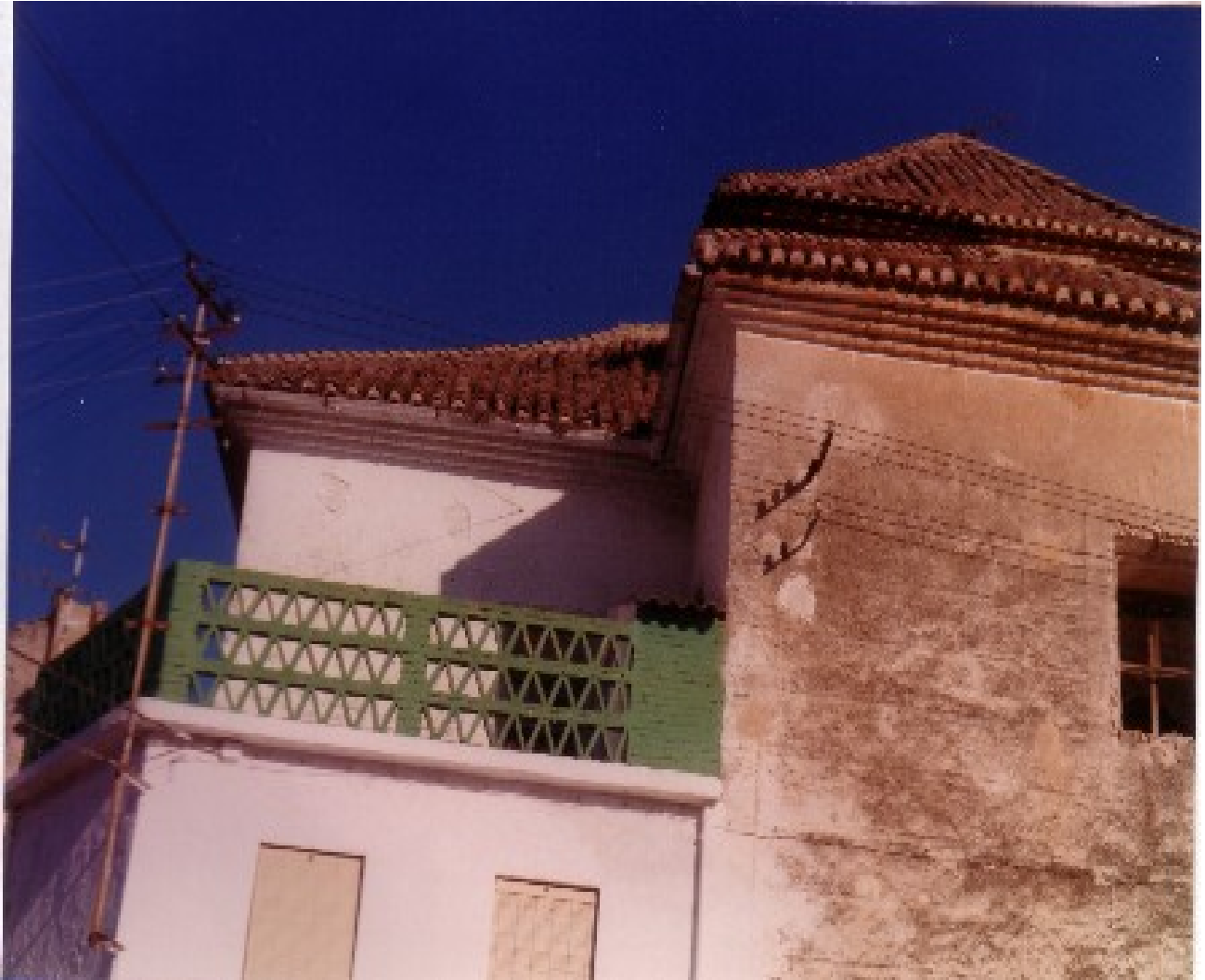
Parte superior y tejado, zona Oeste.