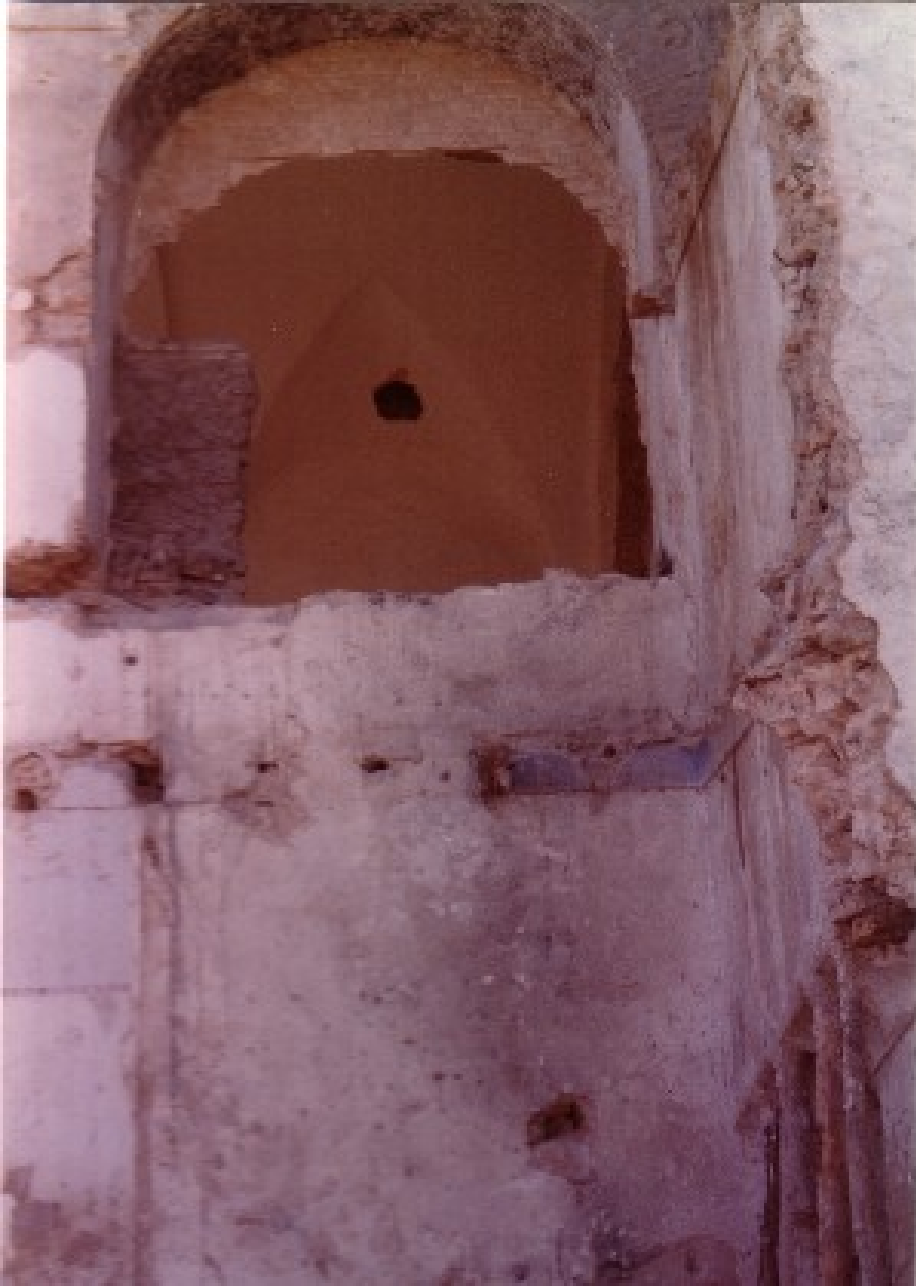
Detalle desde el patio donde en la parte superior se observa el interior de una iglesia.