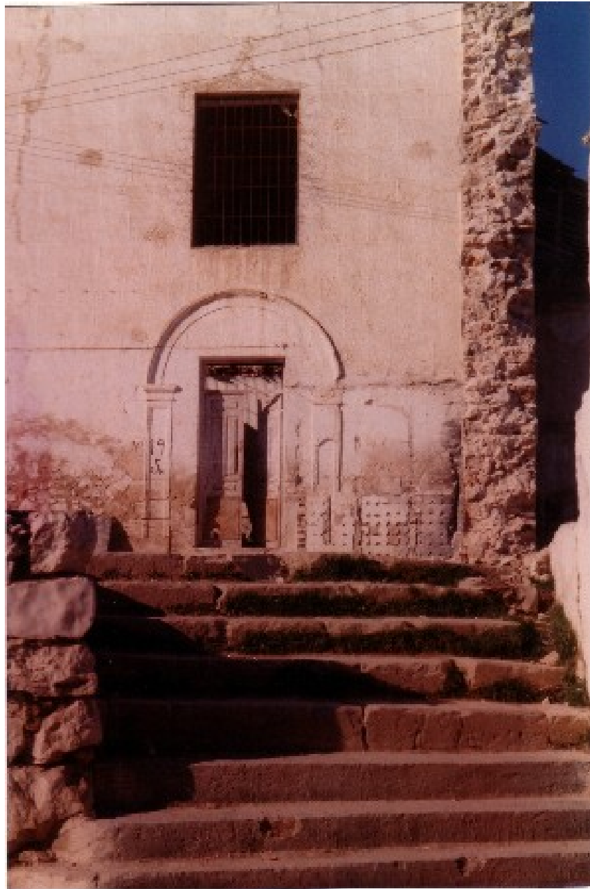
Instantánea de la entrada a la Iglesia por el Sur, conocido por los lugareños como El Arco. En la parte inferior escalinata construida con grandes sillares de piedra.