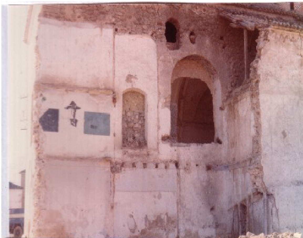
Otra instantánea tomada desde el Oeste, parte del local fue utilizado por los Boy Scout en los años setenta.