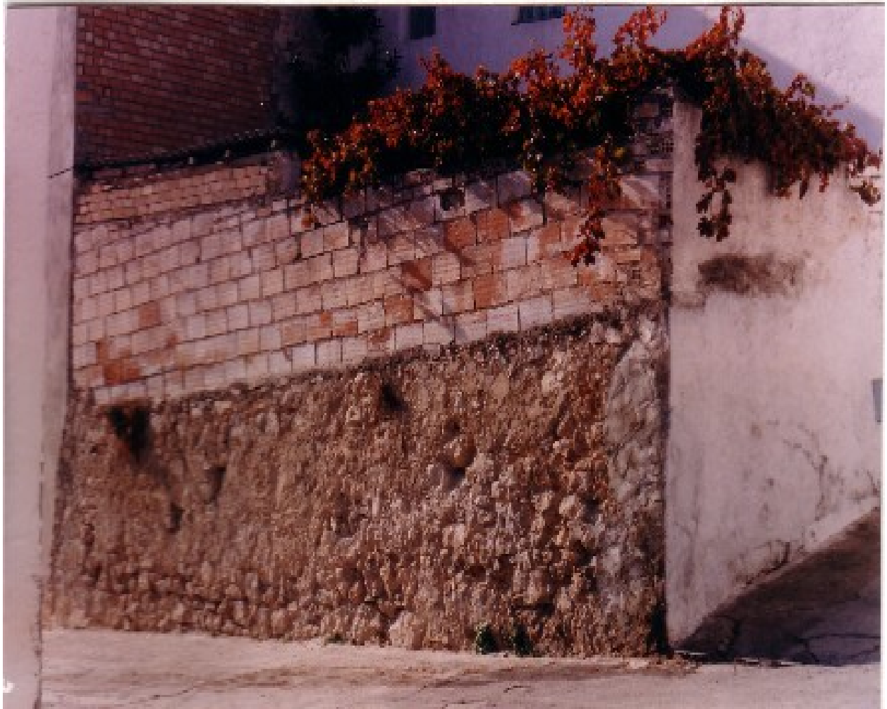
En la parte inferior de la foto, restos de la primitiva pared de la huerta del Convento.