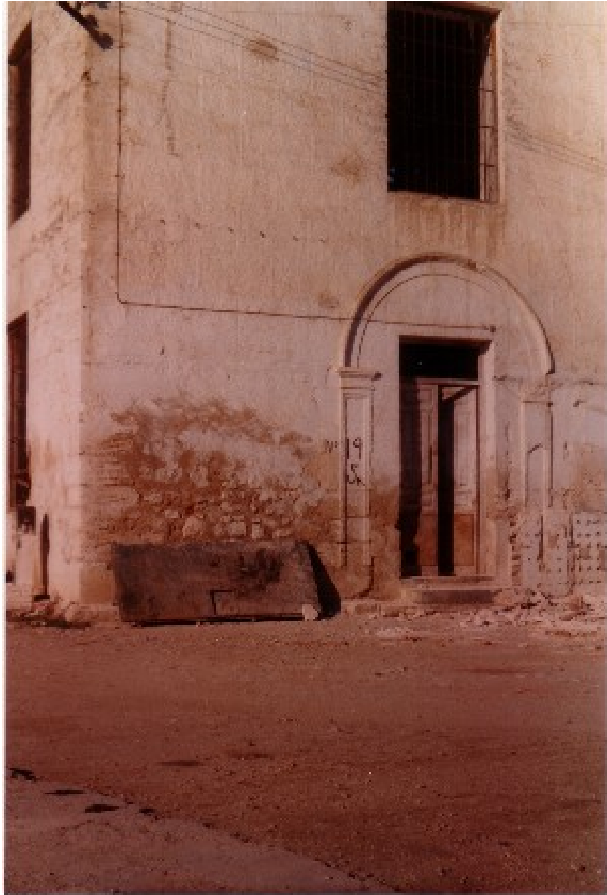
Otra perspectiva desde el sur, donde se aprecian los ventanales que se abrieron para albergar una escuela en los años 50 y 60.